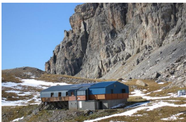
Refuge de Chambeyron

Groupe 2 :Refuge de Chambeyron, Col de la Gypièrè-Retour par le lac premier _1250m_18,4 km