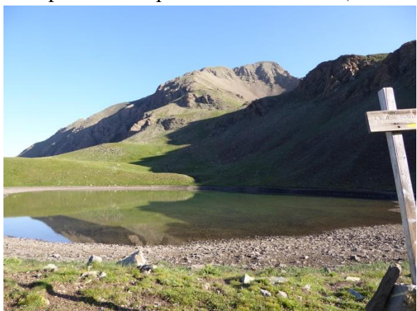
Lac de l'Aupillon

Groupe 2 : L'Aupillon_870 m_10km (Modulable)