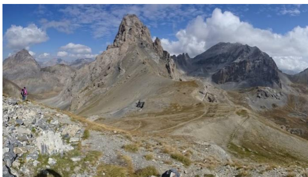
Vue vers Est Vallonnet, Sautron