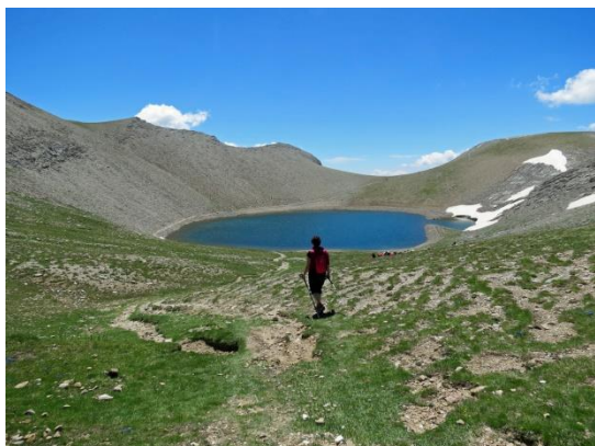
Lac de la Petite Cayolle

Groupe 2 :Lacs de la Petite Cayolle et Lac du Trou de l'Aigle_980 m_16 km