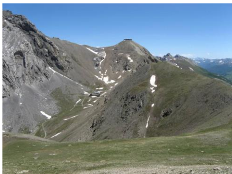
Tête de Viraysse

Groupe 2 : 1065 m - 18km, possibilité de réduire un peu le dénivelé.